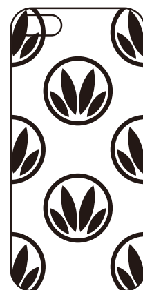
白ベタ用レイヤー